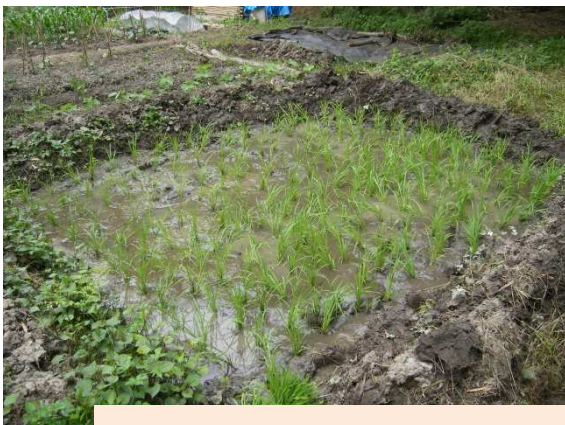
田植えが終わったよへい谷戸の田んぼ。秋の収穫期に「ガチャボン灌漑」の成果が期待される