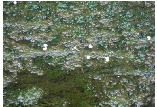
オオカナダモの白い花がひそやかに咲いていた