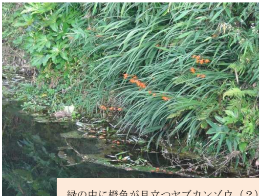
緑の中に橙色が目立つヤブカンゾウ(?)