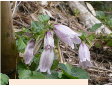
よへい谷戸のホタルブクロ