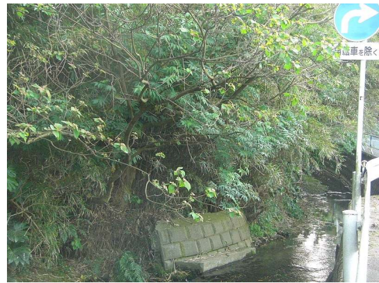
< 笹竹で覆われていて見えなかった護岸が姿を現わした：右が刈込後 >