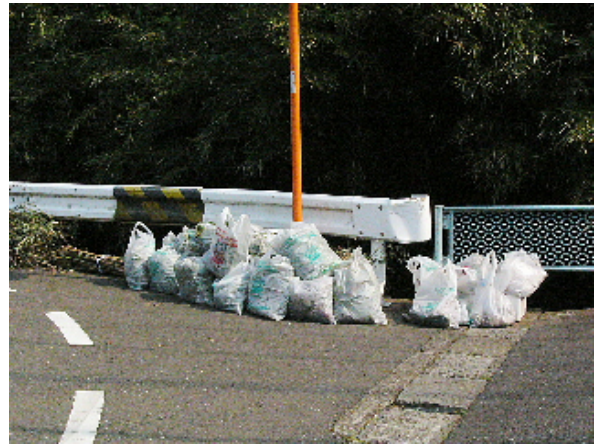
今回集めた草木ゴミ・不燃ゴミ(一部)